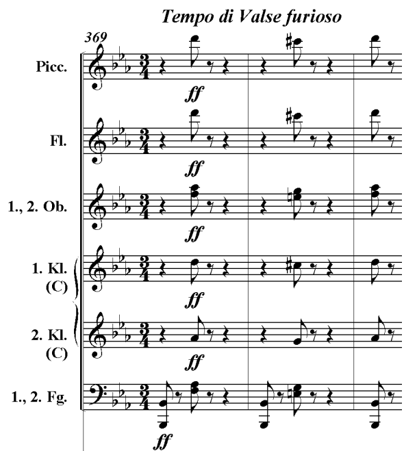
„Danse diabolique“, Auszug aus der Partitur

Instr.: 1 Fl + 1 Picc, 2 Ob, 2 Klar in C, 2 Fg; 4 Hr, 2 Trp, 3 Pos; Pk + Perc; Str.